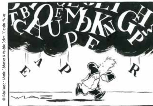
© Réalisation Marie Bédacier & Valérie Solvit / Dessin : Wiaz

Le pays de Jules Ferry et de l'école obligatoire compte plus de 3,1 millions d'illettrés, parmi eux, on recense plus de 1,8 million de salariés et ces chiffres vertigineux sont en constante évolution depuis plus d'une quinzaine d'années. Comment aider ces personnes à conquérir leur autonomie d'adulte ?