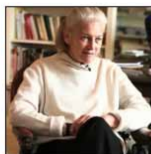
INTERVIEW Elisabeth Badinter