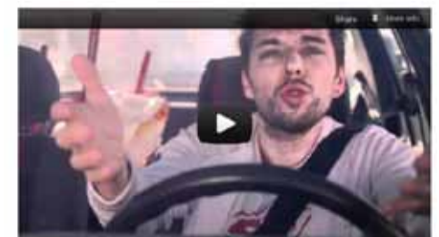
Le prix spécial du Jury du Festival SPS-Mot à Maux, des vidéos contre l'illettrisme : « illettrisme tous concernés », un film de Marc Ory

France Télévisions a également confirmé notre partenariat avec plusieurs chaînes du groupe.